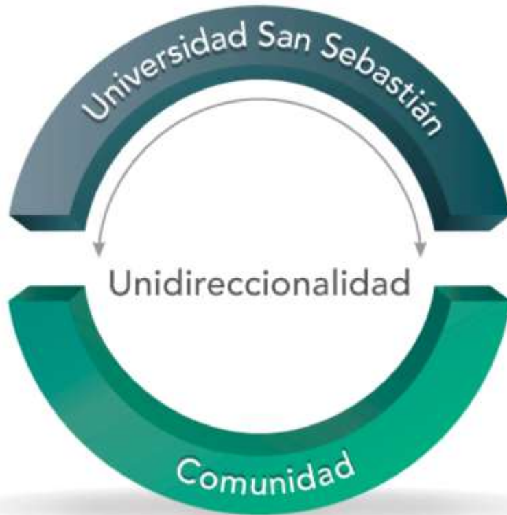
— INSTANCIA TRADICIONAL —