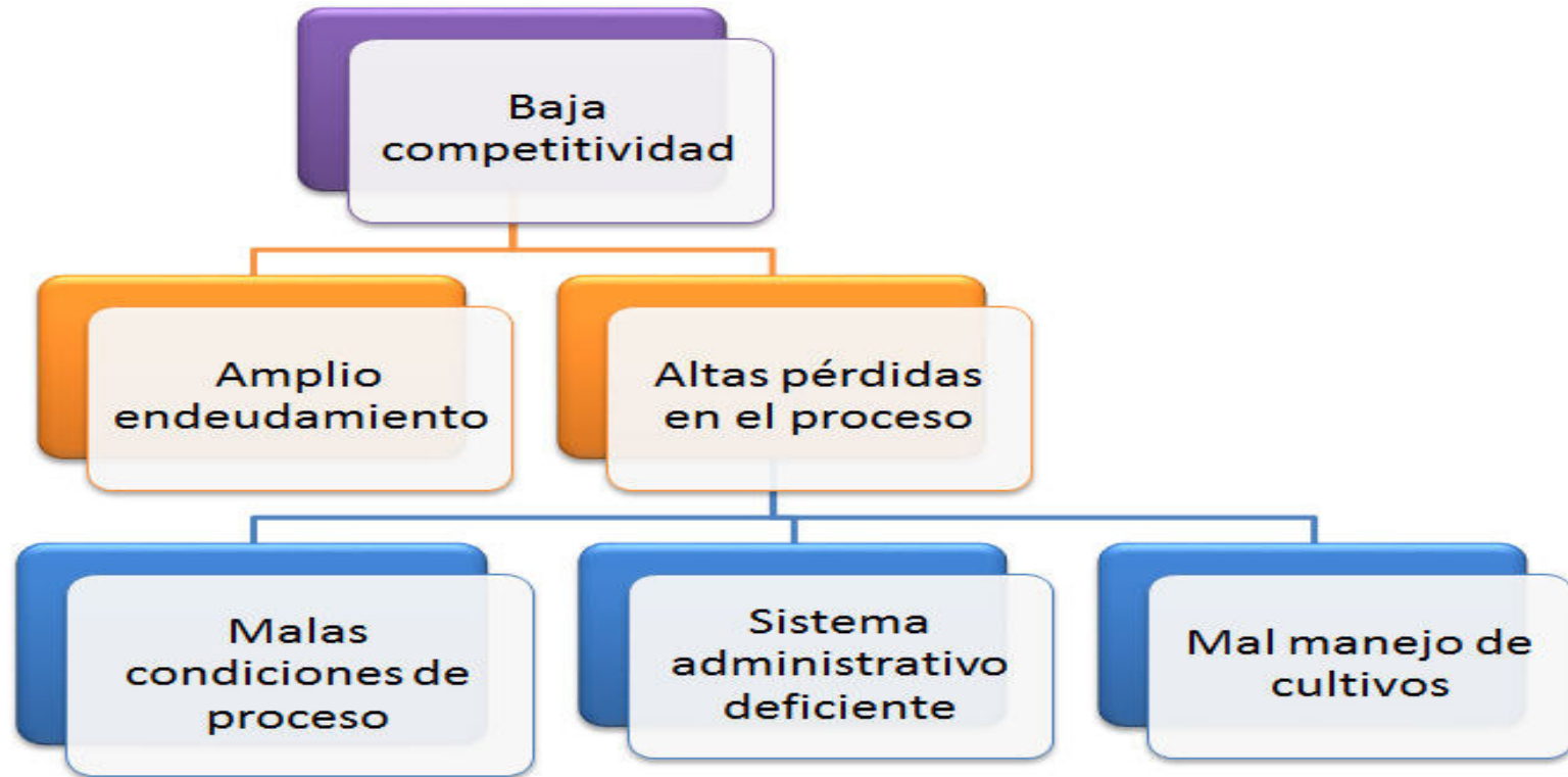
Figura 2 : ARBOL DE PROBLEMAS