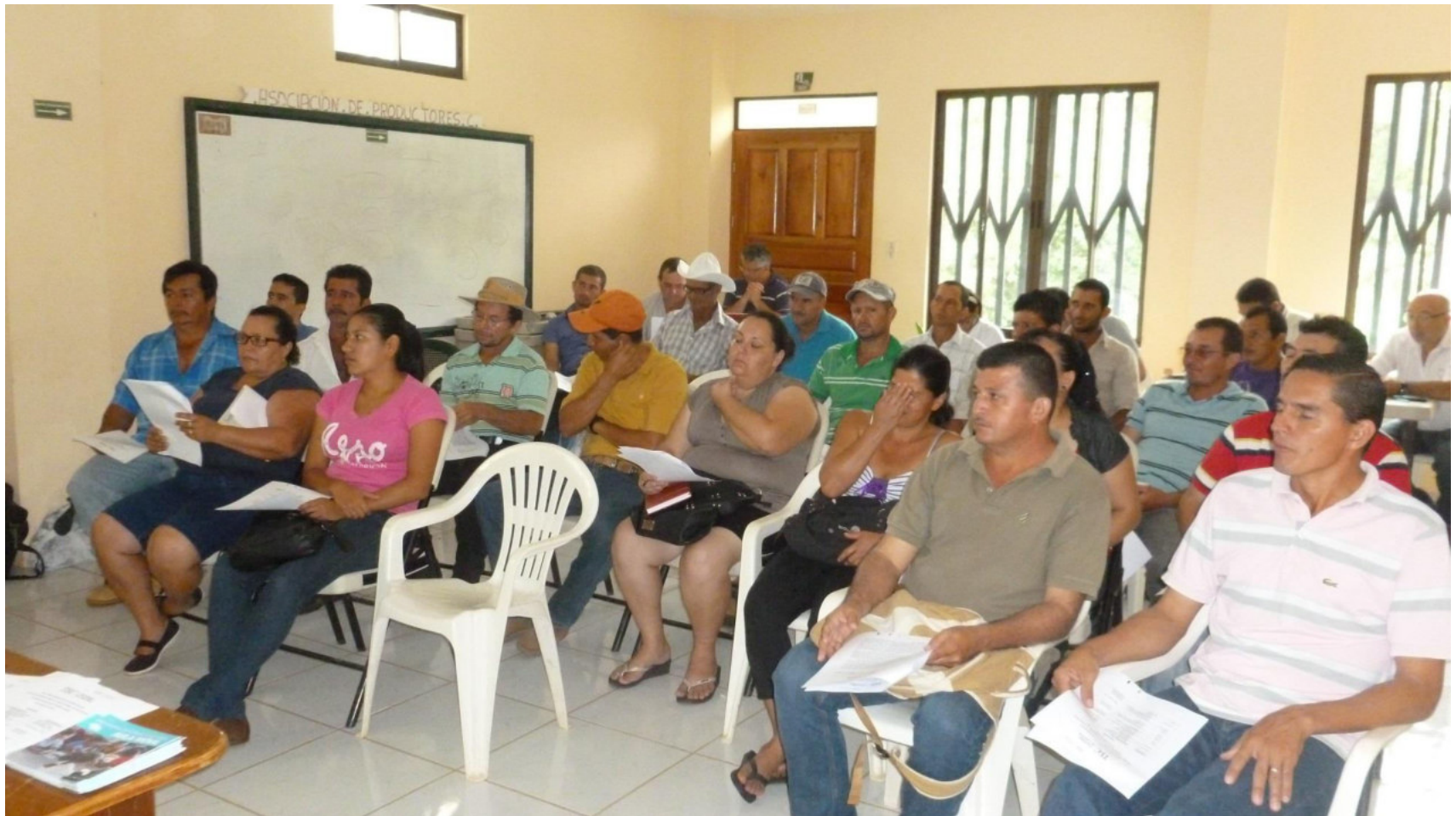
Figura 1: Participantes en I Taller: Identificación de problemas