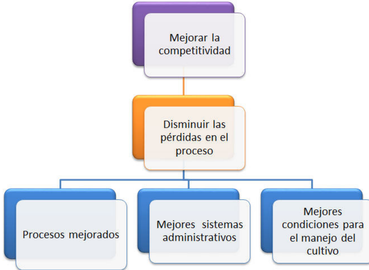
Figura 4: Árbol de objetivos