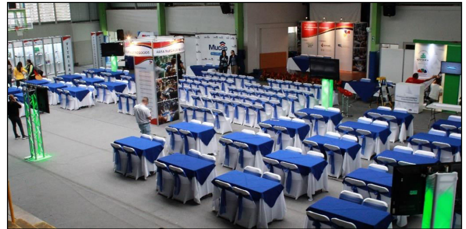
Sede del III Encuentro de Encadenamientos Productivos